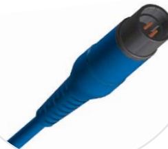
Siemens - kompatibel