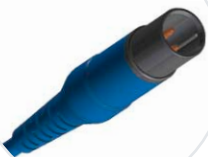
HP/ Philips - kompatibel